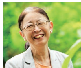
基調講演 村木 厚子氏

持続可能な共生社会に関心を抱く多様な分野の方に向けて、「農業」×「福祉」が創る価値を共に考え、ノウフクプロジェクトに参加するきっかけの場として、本フォーラムを開催します。「農福連携×SDGs」の切り口から、多分野のキーマンや実践者を招き、基調講演、プレゼンテーション、トークセッションを行います。共生社会を具現化する「農福連携」の今を、是非実感ください。