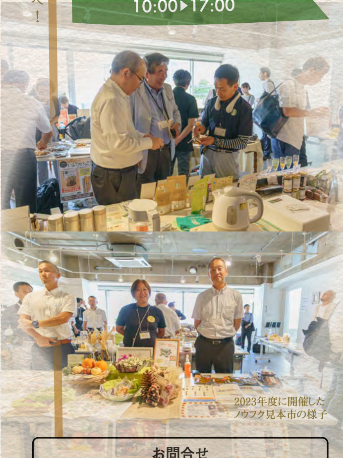
2023年度に開催したノウフク見本市の様子